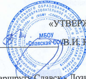
Схема движения школьного автобуса по маршруту Славск - Лозняки - Ленинское - Ржевское - Лужки - Славск

Директор _____ МБОУ «Славская СОШ» В.И. Киселев/